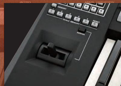
اهرم کنترل با عملکرد قابل تخصیص

دیگری مانند تراک بیضدا و سایر پارامترها را می توانید تخصیص دهید و در کوتاه ترین زمان تغییر دهید. این ویژگی دورنمای دیگری را به عملکرد شما اضافه خواهد کرد. رنگ و بوی بی نظیری به اجرایتان بدهید!