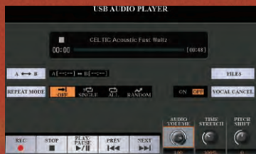
پخش کننده صدای USB