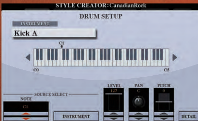
نمایشگر تنظیم درام

در ایجادکننده سبک می توانید پارامترهای مختلفی از کیت درام را با جزئیات دقیق ویرایش کنید، همچنین می توانید "ساز" دلخواهتان را با چیزهای مختلفی از کیت درام ادغام کنید. از نواختن سبک های مختلف با کیت درام بی نظیرتان لذت ببرید!