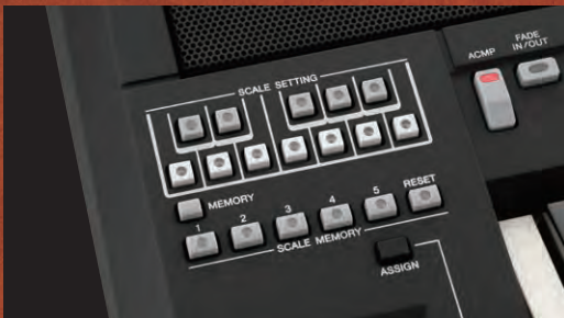
تنظیم مقیاس و دکمه های تنظیم مقیاس

صدای جدید "آوای فوق العاده شرقی" می تواند ویژگی های بی نظیر این سایت را به نمایش بگذارد، مثل ویراتو، تر مولو و بسیاری از دیگر موارد. حتی برای صداهایی که آوای فوق العاده ندارند، یک ویژگی جدید به نام "لگاتوی مونو" وجود دارد که به شما امکان می دهد بدون استفاده از اهرم کنترل، ویراتو بنوازید، صدایی کاملاً منطبق بر سازهای رشته ای شرقی. برای همه صداها، دکمه های تنظیم مقیاس می توانند هر نوع تنظیم صدایی را پشتیبانی کنند.